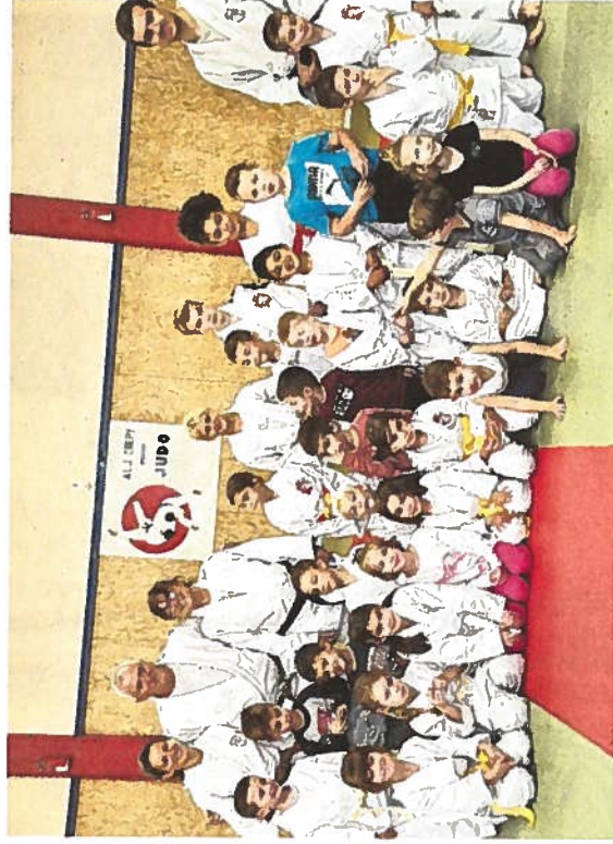
Les premiers participants ont le sourire. Trente ont renouvelé leur licence en juin.

Il précise encore que la pratique de ce sport qui est physique vaut d'abord par l'état d'esprit et que