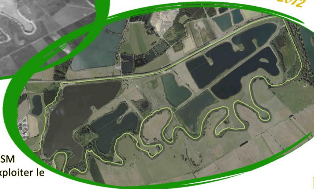
Photographie aérienne de 2012

Riche en alluvions, matériaux formés par les dépôts minéraux successifs de l'Oise, l'entreprise GSM Italcementi-Group, a souhaité exploiter le secteur en 1991.