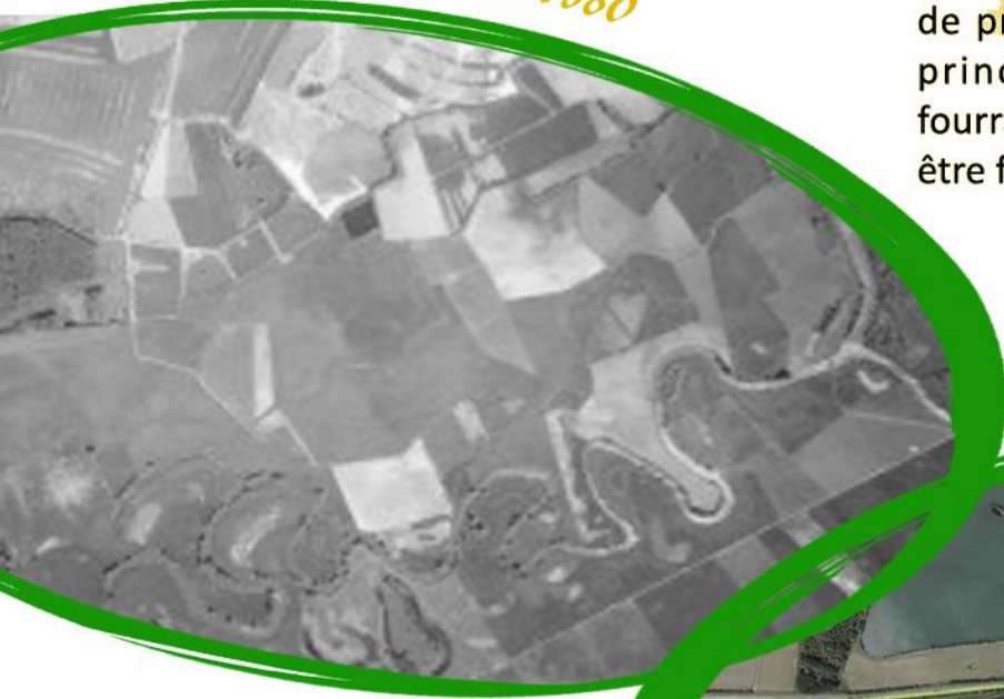
Photographie aérienne de 1980

Ces derniers étaient principalement composés de prairies de fauche, formations herbacées principalement composées de plantes fourragères comme les graminés et destinées à être fauchées.